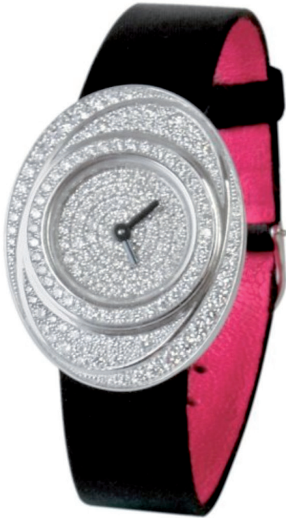
Damoiselle O