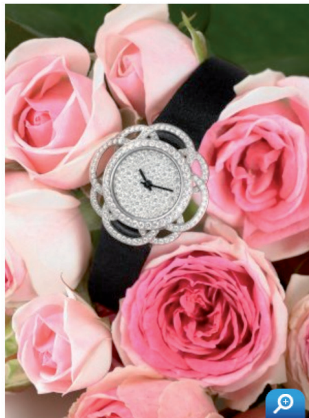
Damoiselle Rosa